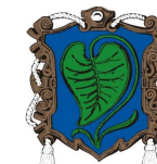
Městský úřad Heřmanův Městec

RYCHOST VĚTRU 1,0 - 12,0m/s, SMĚR VĚTRU 250° AŽ 300° STUP ŇŮ, TEPLOTA 20°C - 25°C